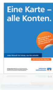
Plakat Das Plakat in den Formaten A4/A2/A1.