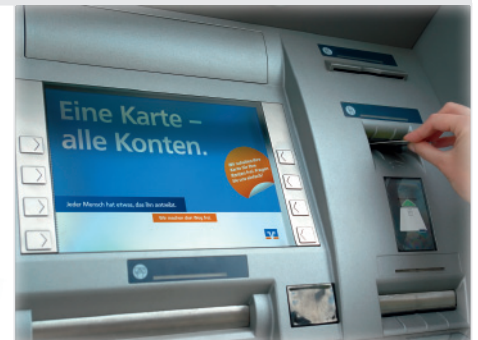
GAA-Screen Die GAA-Screens in den Formaten 450x300px / 600x400px / 740x510px.

Die Mehrkontenverfügbarkeit ist einfach gut und vielfach vorteilhaft – das machen folgende Werbemittel auch bei nur kurzem Kontakt eindrücklich deutlich: