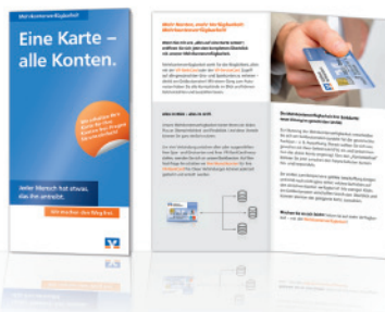
Flyer Der Informationsflyer im Format DIN lang.