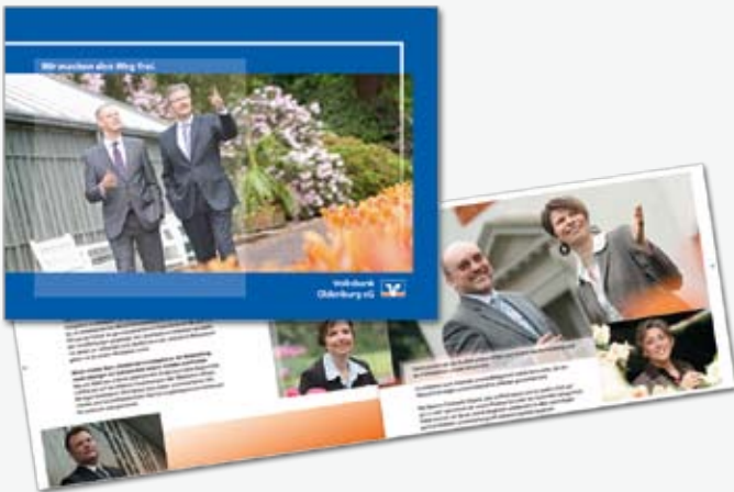
Jahresbericht der Volksbank Oldenburg eG

Sympathische Optik, lesefreundlicher Text, individuelle Inhalte und eine hochwertige Umsetzung – So präsentiert sich ein ansprechender Jahresbericht. Und weil das Zahlenwerk eingelegt wird, kann die Broschüre auch langfristig zu Imagezwecken eingesetzt werden.